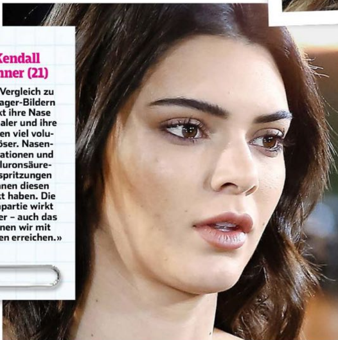
Kendall Jenner (21)

«Auch ihre Stirn ist auffällig glatt. Im Vergleich zu früher wirkt sie hohläugig – wird bei einer Oberlid-Operation zu viel Fett entnommen, entsteht dieser Effekt. Ihre Oberlippe scheint aufgepolstert, und ihre Nase wirkt gerader. Jugendliche Haut kann man mit Säurepeelings erreichen.»