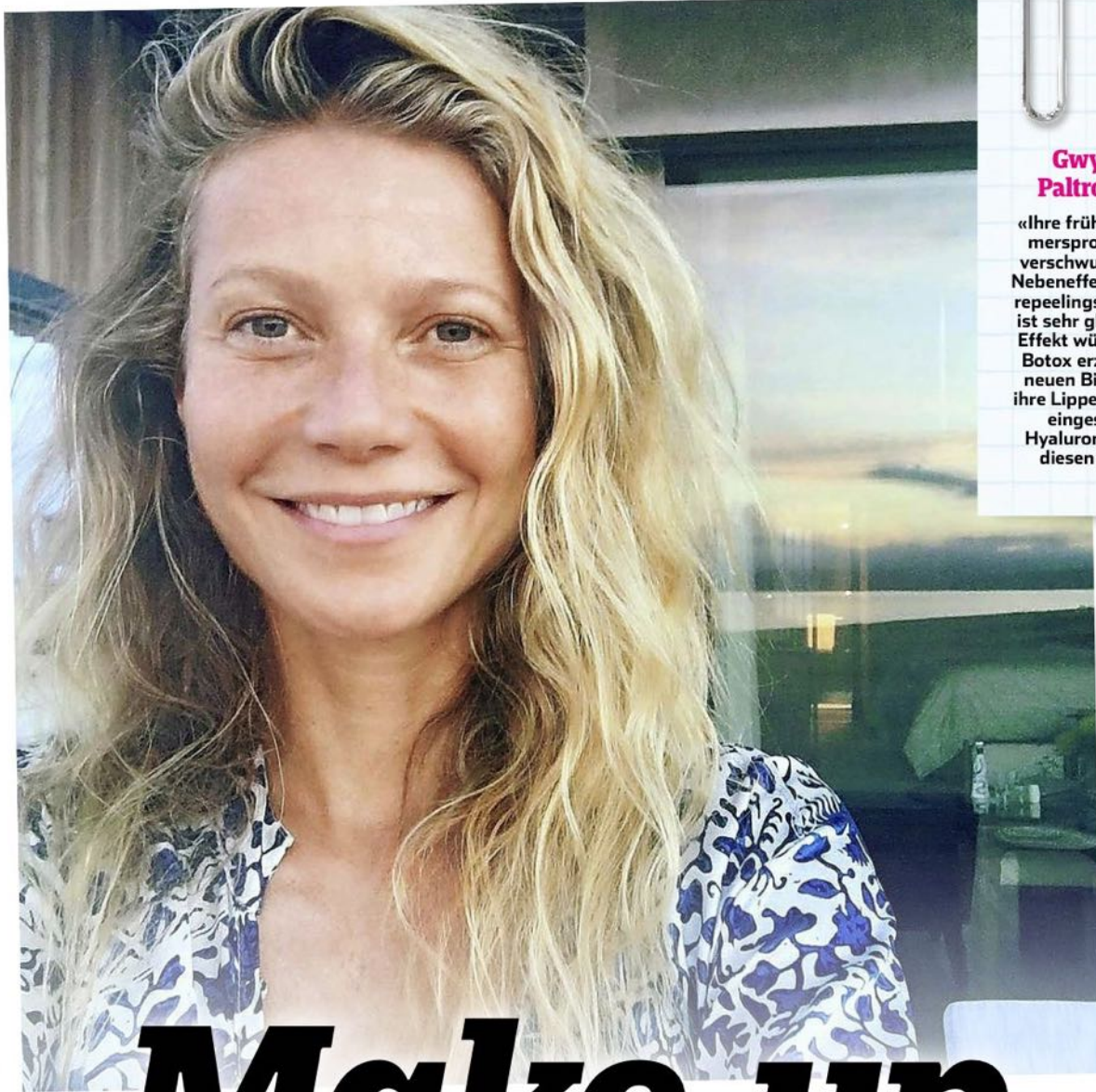
Gwyneth Paltrow (44)

«Ihre früheren Sommersprossen sind verschwunden – ein Nebeneffekt von Säurepeelings. Ihre Stirn ist sehr glatt, diesen Effekt würde ich mit Botox erzielen. Auf neuen Bildern sind ihre Lippen üppiger – eingespritzte Hyaluronsäure hat diesen Effekt.»