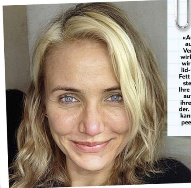
Cameron Diaz (44)

«Frauen in ihrem Alter haben – neben Furchen in der Stirn – normalerweise schmalere Lippen und eine tiefere Falte zwischen Wangen und oberer Mundpartie. Diese Nasolabialfalte glätten wir oft mit Hyaluronsäure. Im Vergleich zu früher scheint ihre Nase anders geformt.»