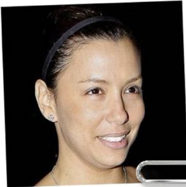
Eva Longoria (41)

«Frauen in ihrem Alter haben – neben Furchen in der Stirn – normalerweise schmalere Lippen und eine tiefere Falte zwischen Wangen und oberer Mundpartie. Diese Nasolabialfalte glätten wir oft mit Hyaluronsäure. Im Vergleich zu früher scheint ihre Nase anders geformt.»